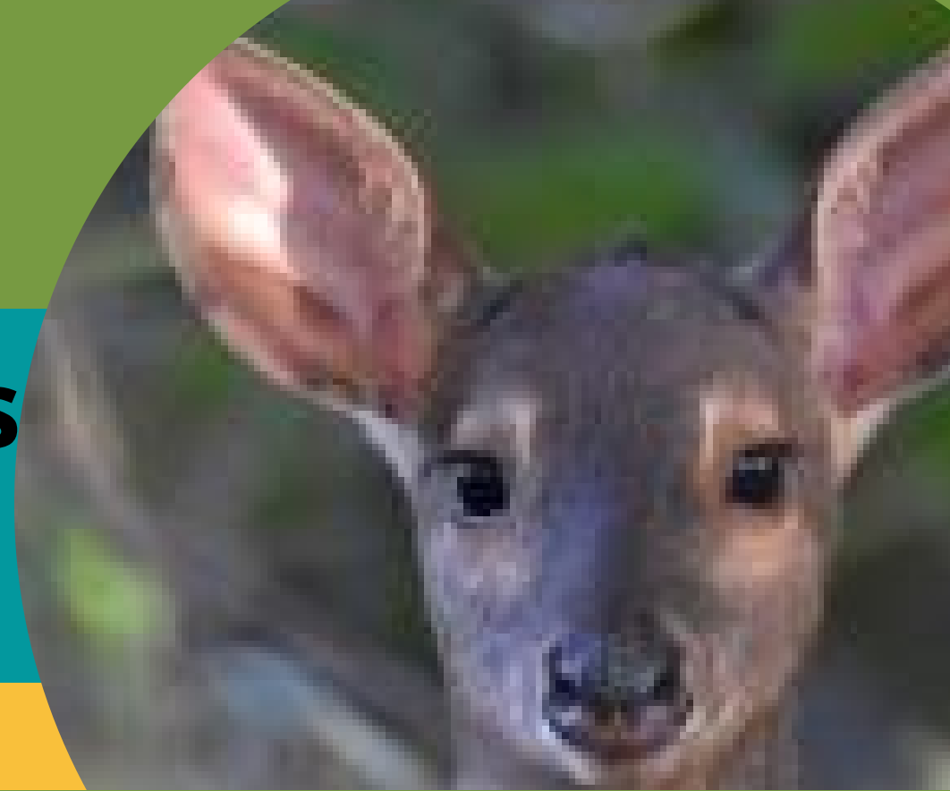
Corzuela colorada Mazama americana